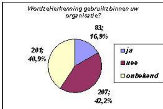
Figuur 2: eHerkenning binnen de eigen organisatie

justitie, processen-verbaal, het ondernemingsdossier, de Belastingdienst en loonadministraties.