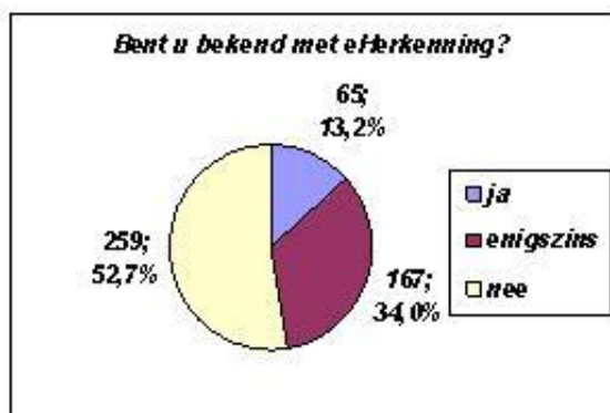
Figuur 1: Bekendheid met eHerkenning

Van de 491 respondenten is 13,2% bekend met eHerkenning. 34% is enigszins bekend en heeft over eHerkenning gelezen of ervan gehoord. Meer dan de helft (259 respondenten) is nog niet bekend met eHerkenning (zie figuur 1).